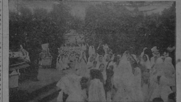
Grupo de niñas de rodillas, oyendo la misa oficiada en el Parque por el señor Obispo

que buscando el camino que conduce a lo alto, halló seguro guía para orientar sus pasos en la tierra. Considérese una sociedad de verdaderos cristianos y quedarán resueltas allí, de hecho, todas las grandes cuestiones políticas, sociales y económicas que conturban hoy profundamente a los pueblos, porque el malestar exterior proviene del desequilibrio interior: Donde todos se tratasen y rigiesen como hermanos, en bienestar íntimo y real, ¿sería posible que hiciera el pañal del aseoin, estallara la b'vola de anarquía, se estafara al prójimo o se optara a nadie en el Estado? ¿Y