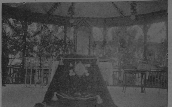
El altar levantado en el Kiosko del Parque donde ofició S. S. Ilustrísima el Sr. Obispo.

que buscando el camino que conduce a lo alto, halló seguro guía para orientar sus pasos en la tierra. Considérese una sociedad de verdaderos cristianos y quedarán resueltas allí, de hecho, todas las grandes cuestiones políticas, sociales y económicas que conturban hoy profundamente a los pueblos, porque el malestar exterior proviene del desequilibrio interior: Donde todos se tratasen y rigiesen como hermanos, en bienestar íntimo y real, ¿sería posible que hiciera el pañal del aseoin, estallara la b'vola de anarquía, se estafara al prójimo o se optara a nadie en el Estado? ¿Y