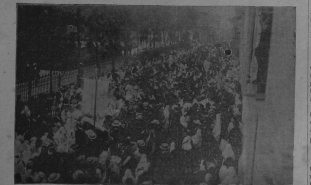
La concurrencia en una de las calles del Parque, a la hora del Santo Oficio

Se cantaron varias veces durante el trayecto, ejecutado por el Seminario y la orfanía de la Catedral, acompañados por la Banda de San José.