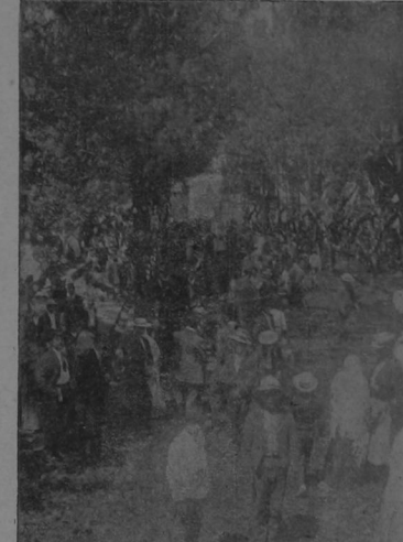
Como se encontraba arreglada el domingo la Avenida de las Damas

De la música que hubo en todos estos lugares daré razón en sección aparte el señor Trullas, que se encargó de esta sección de la céntrica. Hemos de advertir que las bandas militares de San José, Cartago, Heredia y Alajuela participaron en la Gran Pro-