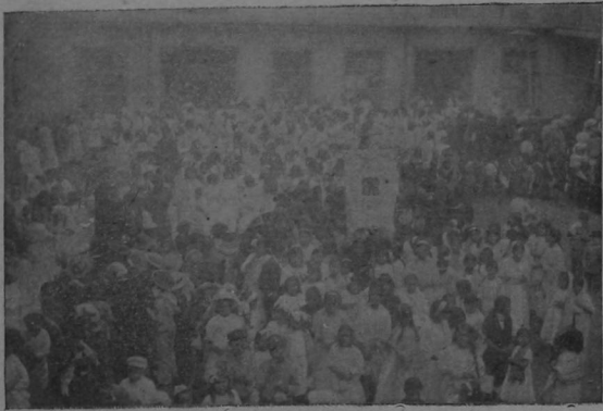
Un millar de niños y niñas de provincias en el patio del antiguo edificio del Cuartel Principal, esperando el desayuno.