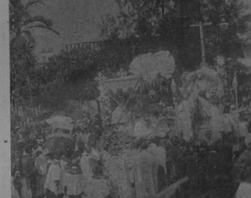
La carroza de la Santa Eucaristía, en la que iba el Obispo y dos Canónigos

De esta imponente ceremonia da una idea muy completa una de las fotografías que publicamos y que fue tomada desde las torres de la iglesia por nuestro redactor señor Borges.